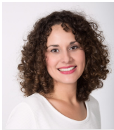
Sandra Liedtke Pressekontakt (derzeit in Elternzeit)