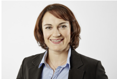
Swetlana Granatella Pressekontakt (derzeit in Elternzeit)